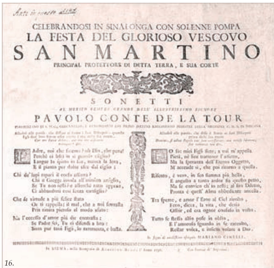
16. Manifesto stampato nel 1756 per i festeggiamenti in onore del Santo Patrono di Sinalunga.

del Viviani nel 1740. portarono il Nome del loro Autore impresso correttamente "Jacomo Gori da Senalonga"; ma quando il Viviani le ristampò nel 1755. vi mise l'aggiunta "Da Senalonga altrimenti Asinalunga". Questo ad dimostra che fù appunto nei tre Lustrì corsi frà quelle due Date, che il Nome del Paese nostro cominciò ad essere alterato. Si tenga memoria di questa Nota, poichè dovremo ritornarci frà breve.