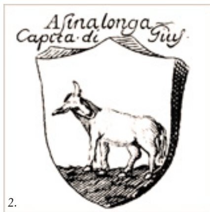
2. Stemma di Asinalunga da “ Sposizione de Colori delle Arme delle Città Terre e Castella dell'Antico e Moderno Stato di Siena ” del Pecci.

«...Con buona pace del nostro Pecci, noi non faremo nessun conto di questa sua opinione che è un po' stracchiata, e rinunziando volentieri al nome di Asinalunga, ci atterremo a quello di Sinalunga, perché a tutto il 1177, tanto gli archivi di questa Comunità, che in quelli della Collegiata, si legge “Senalonga” e “Sinalonga”, e così pure trovasi registrato nell'archivio della città di Siena, nel libro ove si parla dell'aggregazione delle varie comunità allo